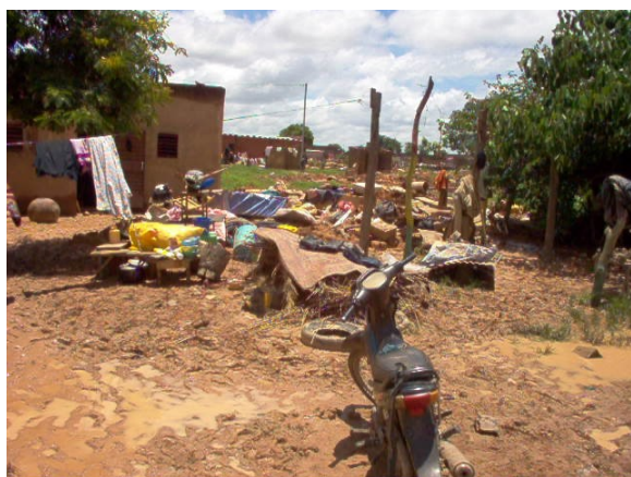
Après le déluge...

Le déménagement s'est donc effectué entre tristesse et joie.