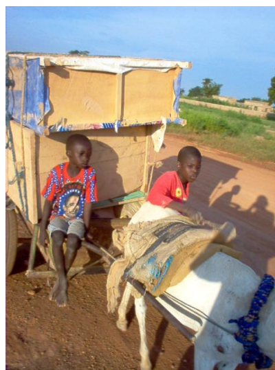
Un camion de déménagement à quatre pattes...