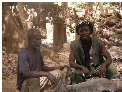
Madi (à droite) et son maître bronzier

Lors de sa visite, il a effectué 5 démonstrations de coulage et il a eu l'occasion de présenter de nombreuses fois son travail d'artisan et son action auprès des enfants burkinabés.