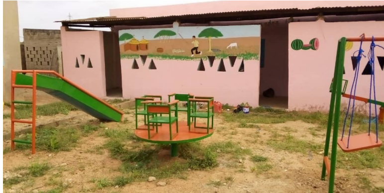
Jeux dans la cour de l'école des Amis du Monde